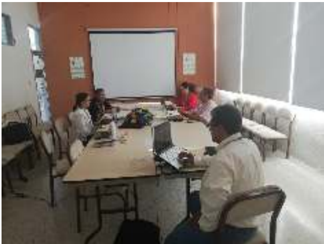
Reunión seguimiento carreras TyT